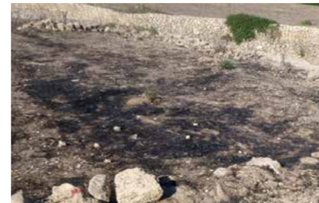
✗ Eżempju ta' ħruq fuq għalqa ta' aktar minn 10m 2