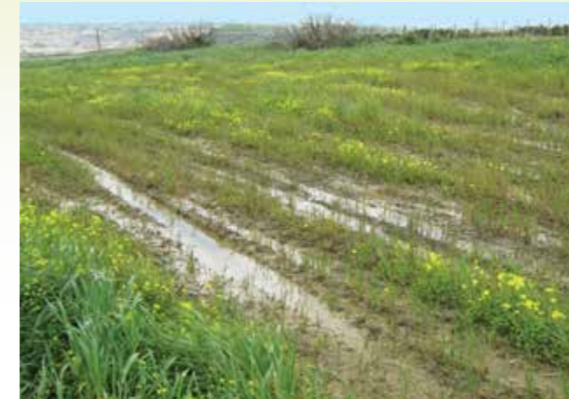
✗ Eżempju ta' tgħaffiġ b'makkinarju goff fl-għelieqi